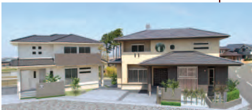
奏かなで Model House 雅みやび