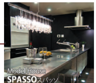
Model House SPASSO スパッソ