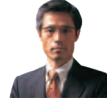
SANO建築設計事務所 前川 豊