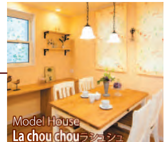
Model House La chou chou ラジョジョ