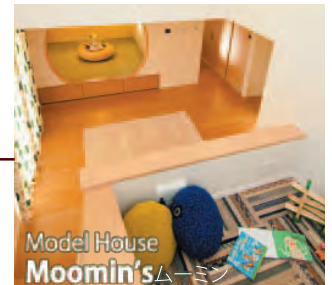
Model House Moomin's ムーミン