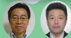
上田支店長 千種運営推進委員長 (三重運営推進会議副議長)