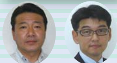
新山支店長 谷運営推進委員長 (三重運営推進会議メンバー)