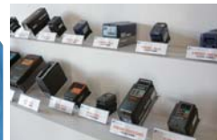
多種多様なインバータ