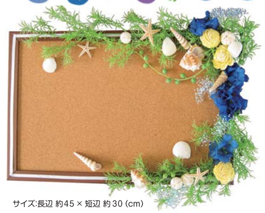
サイズ:長辺 約45 × 短辺 約30 (cm)

親子でたのしく創作活動！ 夏祭りのスーパーボール、海で拾った貝がら、 山で見つけた木の実など夏の思い出をデコしよう！