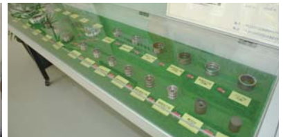
工場ロビーでは、ベアリングができるまでの工程を詳しく見れます。