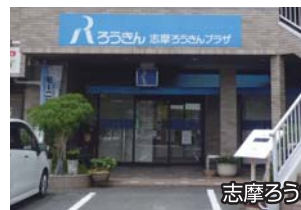
志摩ろうきんプラザ