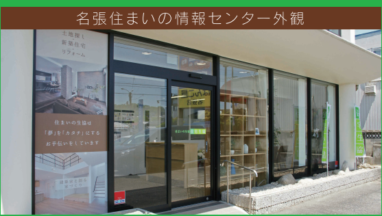
名張住まいの情報センター外観